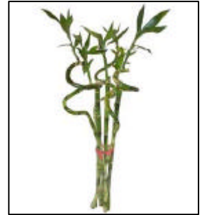
Planta de Dracaena spp.

http://web.uniud.it/zanzaratigre/Cenni.html