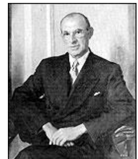
Dr. Norman McAlister Gregg