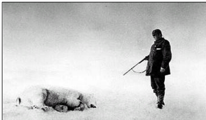
1897. Andrée junto al primer oso que mataron en la banquisa

Los diarios mencionan los siguientes síntomas de enfermedad: diarreas