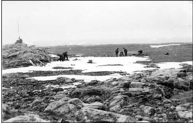
1930. buscando restos en el campamento de Andrée en Kvitøya

Cerca del cuerpo de Andrée se encontró un rifle, pero en su momento, no se informó de si estaba cargado o no. En cualquier caso no hay ningún informe acerca de orificios de bala u otras lesiones en los cuerpos o vestiduras. En el campamento había grandes