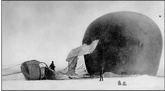
Andrée y Fraenkel junto al globo caído en la banquisa. Foto sacada por Strindberg el 14 de Julio de 1897

Las lecturas de los diarios de Andrée y de las notas de Frænkel han sido fundamentales para reconstruir lo sucedido durante aquellos meses. Especial importancia han tenido las fotografías de Strindberg. Con su cámara de siete kgs tomó cerca de 200 fotografías de una calidad asombrosa, sobre todo si tenemos en cuenta las condiciones en las que se sacaron.