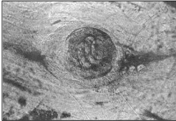
Larva de Trichinella fotografiada por el doctor Tryde para su libro "De döda på Vitön". Estaba en los restos de carne de oso encontrados en el campamento.

Apreciación: se excluye la hipervitaminosis A como causa de síntomas y de muerte.