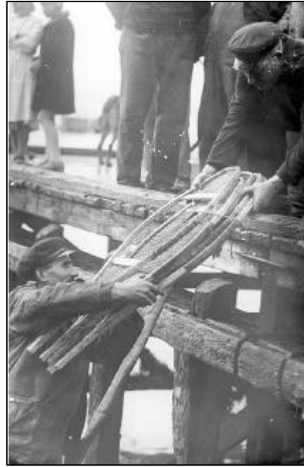
1930 Recuperando unas raquetas de nieve de la expedición

Botulismo. Enfermedad causada por una potentísima neurotoxina, elaborada por Clostridium botulinum que ocasiona una parálisis simétrica descendente. C. botulinum es un bacilo grampositivo anaerobio muy abundante en el suelo y en los sedimentos acuosos, que forma esporas termorresistentes. Existen varios tipos antigénicos (A,B,C,...) cada uno de los cuales produce su correspondiente exotoxina al pasar a la forma vegetativa. Estas exotoxinas son termolábiles. La carne de los