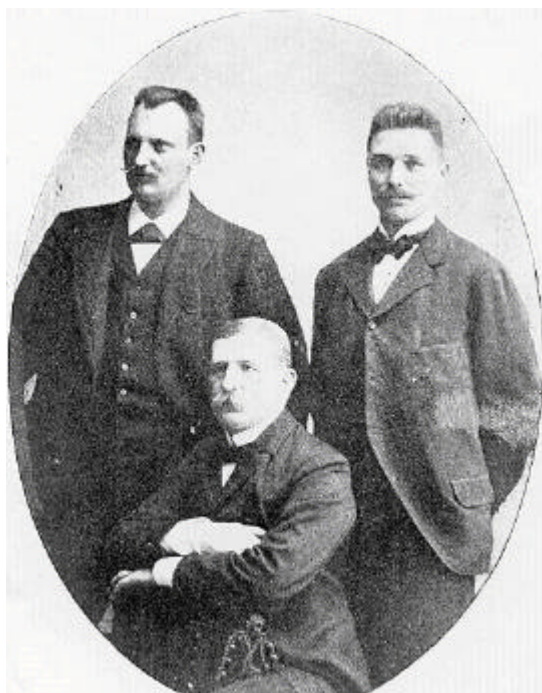
K. Fraenkel, S. A. Andrée y N. Strindberg

Andrée había nacido en 1854. A los 30 años consiguió un puesto de ingeniero en la Oficina Real de Patentes en Estocolmo. Pero sus inquietudes eran otras: era un apasionado de la tecnología y aún en mayor grado de los globos. En 1893 se compró su primer globo, el Svea . Con él hizo, al menos nueve viajes, recorriendo unos 1.500 km. Poco después comenzó a desarrollar su gran sueño. Un largo viaje en globo de hidrógeno que partiría desde el archipiélago Spitsbergen, cruzando el océano ártico hasta Rusia o Canadá y sobrevolando en su trayecto el polo