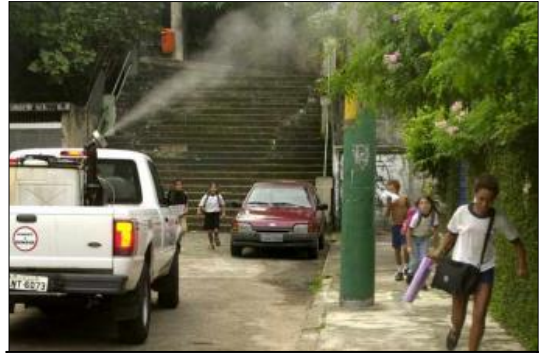
Una camioneta rocía con insecticida plantas y árboles en Río de Janeiro para prevenir el dengue

Las autoridades sanitarias de Brasil confirman la epidemia de dengue en su país: 120.570 casos, la mitad de ellos en Río de Janeiro. De ellos, 647 casos han sido dengue hemorrágico y se han producido 48 muertes la mitad de ellas en niños menores de 13 años. Esta alta patogenicidad se debe a que la epidemia actual es por el serotipo DEN-2, que está re infectando a una población sobre la que en los últimos cinco años actuaba el serotipo DEN-3.